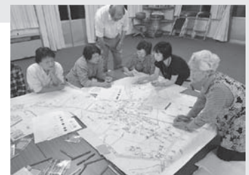
支えあいマップづくり