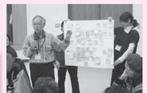
写真は、10月31日に開催された「みんなの元気交流会」の様子です。

詳細については、久慈市地域包括支援センター（☎61-1557）までお問い合わせください。