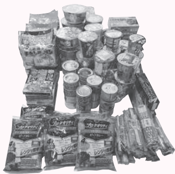
ご提供いただいた食品の一部