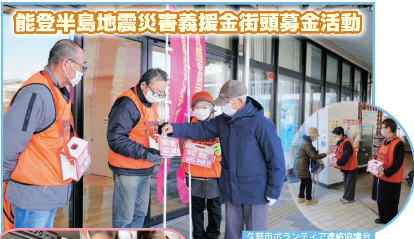
久慈市ボランティア連絡協議会