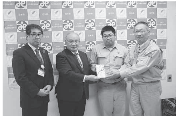
平成3年から歳末たすけあい募金にご協力いただいている日本地下石油備蓄㈱久慈事業所の皆様