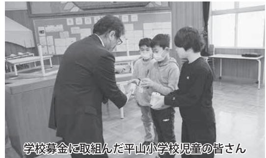
学校募金に取り組んだ平山小学校児童の皆さん