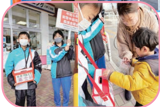
中学生ボランティアグループ Dreams ブロッコリー