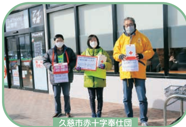
久慈市赤十字奉仕団

1月14日～2月11日にかけて久慈市ボランティア連絡協議会、中学生ボランティアグループ Dreams ブロッコリー、久慈市赤十字奉仕団は、それぞれ能登半島地震災害義援金の街頭募金活動を行い、多くの皆さまからご協力をいただきました。寄せられた義援金は、中央共同募金会及び日本赤十字社を通じて被災地へ届けられます。ご協力いただいた皆様、ありがとうございました。